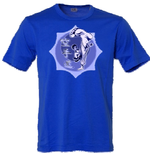
Neu: SKR Kinder T-Shirt

Es ist vollbracht! Im 2012 startet das neue SKR-Angebot für Kinder mit zwei Zentraltrainings. Diese Termine muss man unbedingt dick in der Agenda anstreichen.